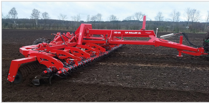
12,30 m Tip-Roller XL med Cambridgeringe og 2-bullet Spring-Board