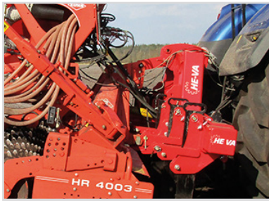
4,00 m Combi-Tiller PTO mit 6 Zinken