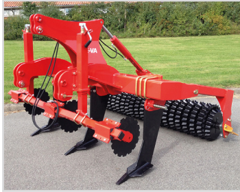
2,50 m avec Quick-Push et rouleau étoile.