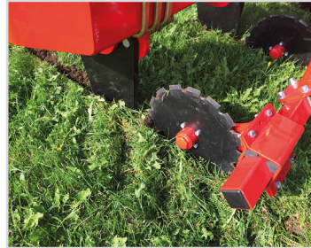
Disques crénelés Ø400 mm devant chaque dent.