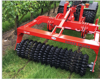
1,80 m avec Quick-Push et rouleau étoile.