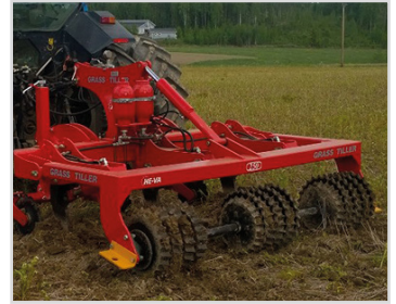
2,50 m avec sécurité autom. hydr. et rouleau étoile synchronisé.