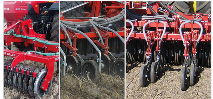
Band-Aussaat vor der Packerwalze

Die Säeinheiten sind mit Doppelscheiben ausgerüstet und werden im Parallelogramm geführt (Sä-scheiben Ø 350 mm, Stärke 3 mm; Druckrolle Ø 330 mm, Breite 50 bzw. 70 mm).