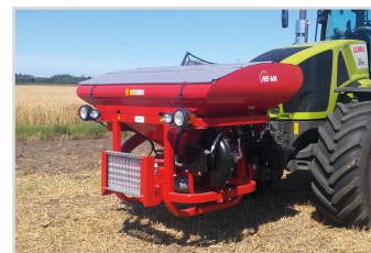
Trémie Frontale - Front-Tank