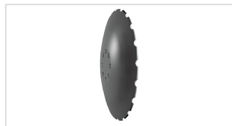
Ø510 x 5 mm "Sabre discs" HD aggressiv