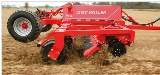
5,00 m m/V-Profilvals och materialdämpare.