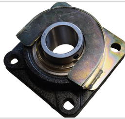
Lejebeskytter for pakvalse