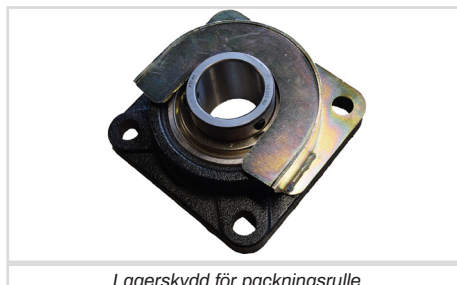
Lagerskydd för packningsrulle