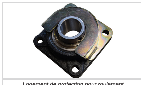
Logement de protection pour roulement