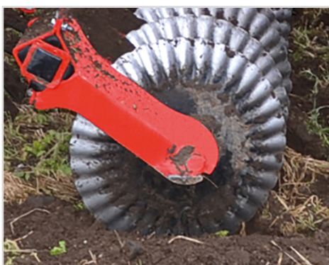
Disque Ø570x5 mm "Sabre-disc" d'incorporation des résidus