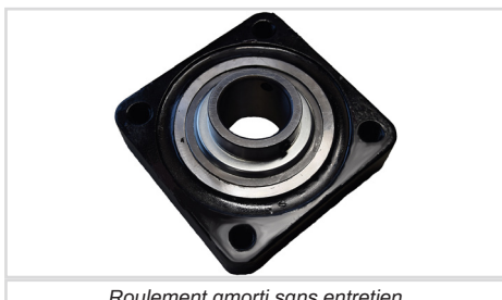
Roulement amorti sans entretien