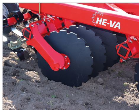
Disque standard Ø610mm – à profil de coupe fine