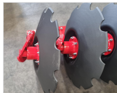
Disque Ø610mm à profil de coupe grossière