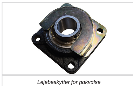
Lejebeskytter for pakvalse