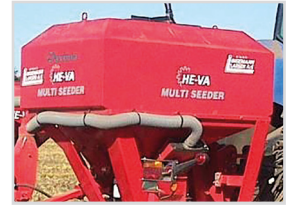
1150-8-HY-FZ-AC 1.014x1.640 mm H= 1.530 mm