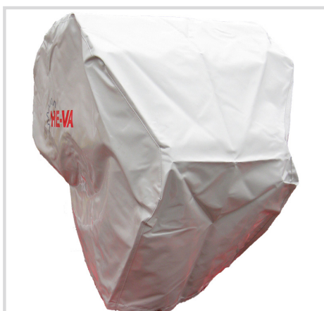
Bâche pour semoir Multi-Seeder

*Longueur câble d'entraînement = 1,8 m. Autres longueurs disponibles à la demande.