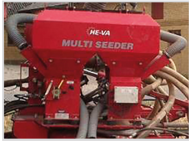
Twin 2 x 100 593x926(1.180)mm H=935 (1.075) mm