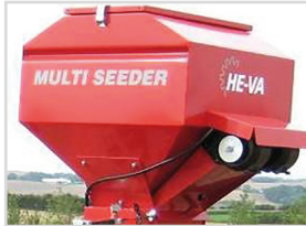
200-8-EL 650x650(770)mm H=980 mm