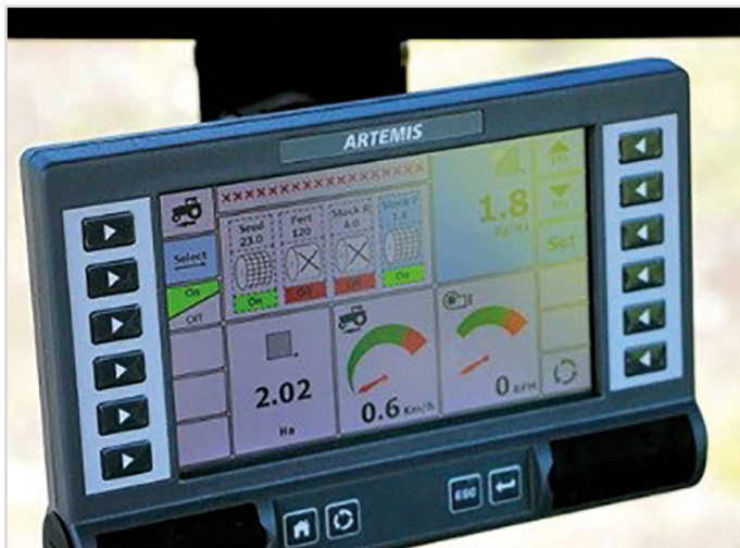
HE-VA Terminal: Pour contrôle Multi-Seeder Twin et sur machines avec 2 à 3 trémies de semences.