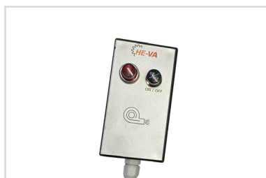
Interrupteur on/off de la turbine électrique