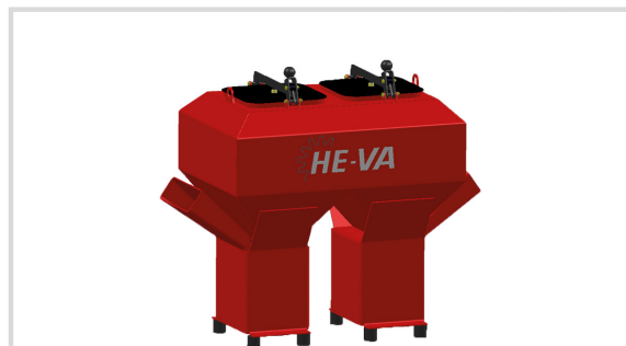
Multi-Seeder Twin 90/140-12-HY-AC 668 x 800 (1.180) mm H=900 (1.076) mm