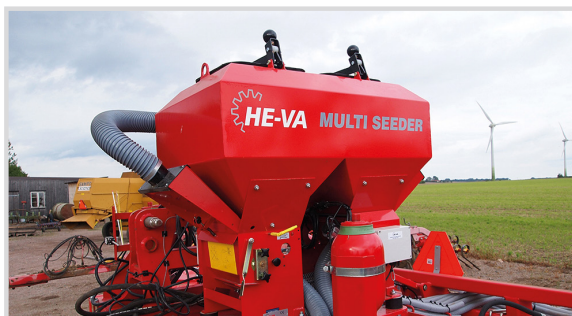
Multi-Seeder Twin 2x100-8-HY-AC 593 x 926 (1.180) mm H=935 (1.075) mm