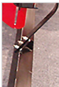
Barre de nivellement