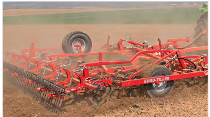
6,00 m Euro-Tiller m/ förharv, Spring-Board fjäderpinnsplanka, Spring-Board efterharv, långfinger-efterharv och reservhjul.