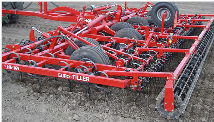
8,00 m Euro-Tiller m/ Spring-Board plank, vals inkl. långfinger-efterharv och reservhjul.