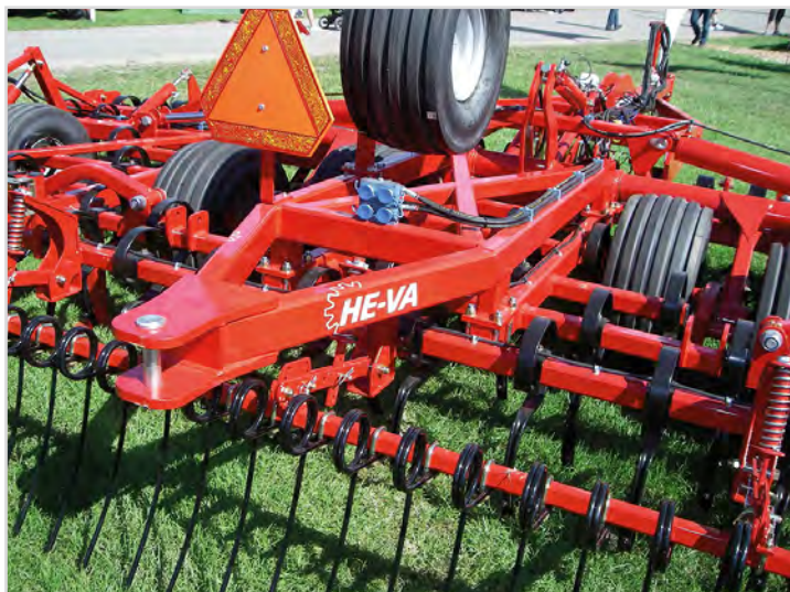
Euro-Tiller med drag för t.ex ringvält.