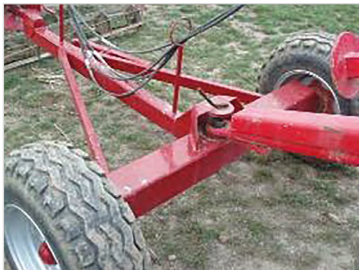
Dolly: Hjulsæt, der muliggør tilkobling af tromle bag harven - 11,5/80 x 15,3 hjul