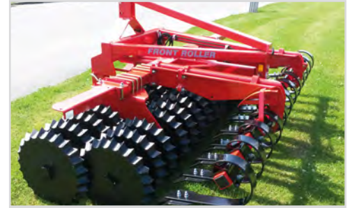
3,00 m Front-Roller Twin (jumelé) avec anneaux Etoile Ø 550/550 mm et Spring-Board