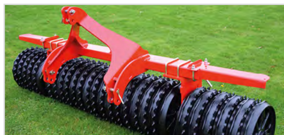
Front-Roller avec attelage fixe 3-points - non auto-directionnel