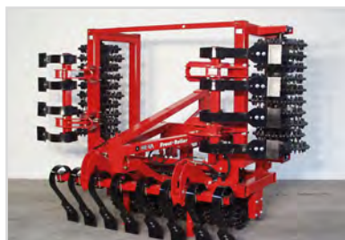
4,0 m Front-Roller avec Cross-kill Repliage hydr. et Spring-Board