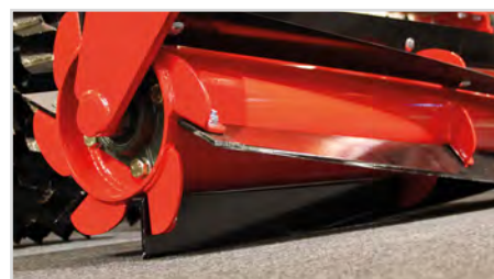
Top-Cutter (rouleau hacheur)