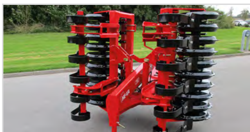
Front-Roller 3,00 m 2-sections avec V-profil, repliage hydr. et Spring-Board