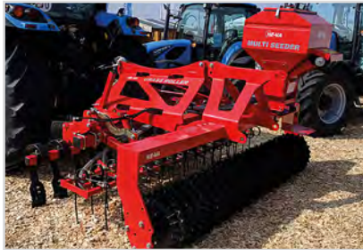
2,90 m lyftburen Grass-Roller med Stjärnring och utrustningspaket 4