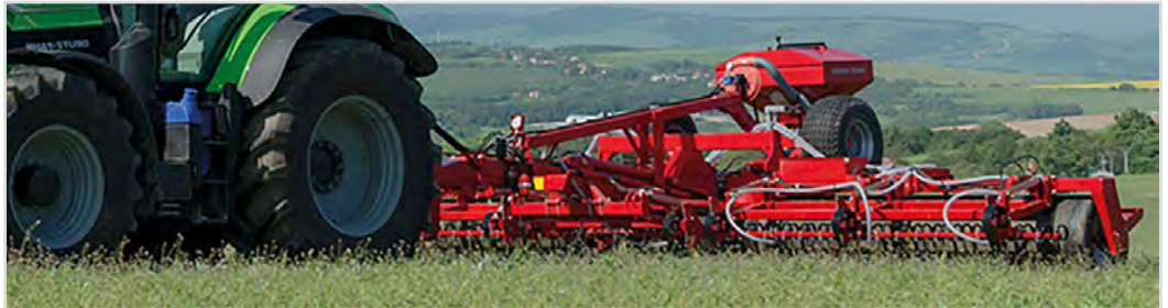
6,30 m Grass-Roller Ø710 mm med utrustningspaket 3 och Multi-Seeder