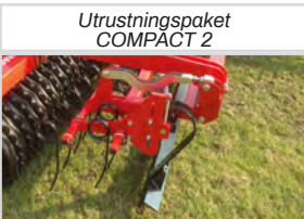
Utrustningspaket COMPACT 2

*Kräver ytterligare 1 st. dubbelverkande oljeuttag