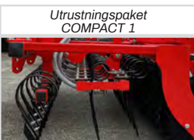
Utrustningspaket COMPACT 1