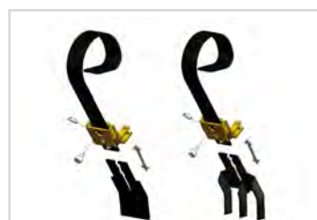
Easy-Change - Snabbytes-system av slipplattan inkl. En sats slipplattor och en sats skorpbrytarstål med 3 fingrar.