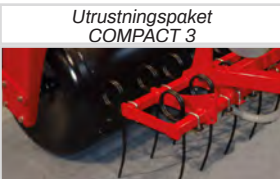
Utrustningspaket COMPACT 3

*Kräver ytterligare 1 st. dubbelverkande oljeuttag