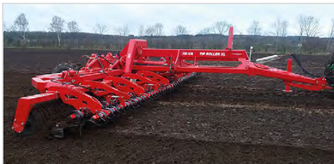
12,30 m Tip-Roller XL med Cambridgeringar och 2-axlad Spring-Board