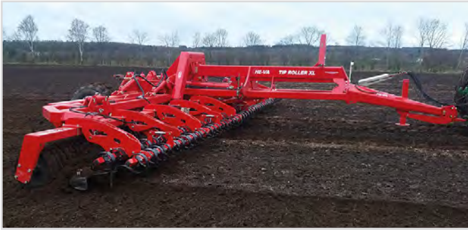
12,30 m Tip-Roller XL med Cambridgeringe og 2-bullet Spring-Board