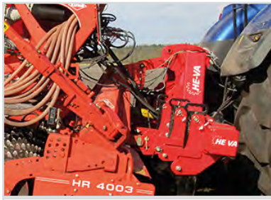
4,00 m Combi-Tiller PTO med 5 pinnar