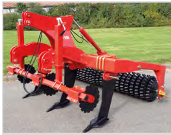
2,50m m/Quick-Push und Sternwalze