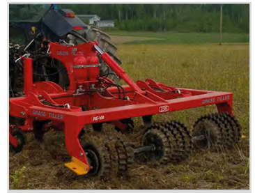
2,50m m/hydr. Steinsicherung, und Sternwalze.