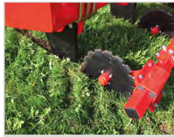
Ø400 mm gezackte Schneidscheiben