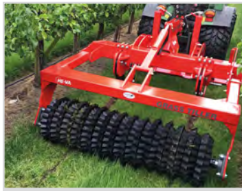
1,80 m m/Quick-Push und Sternwalze