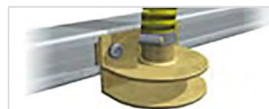
Breite Aussaat per Prallteller vor Packerwalze

Nur eine Spezialwalze für Raps/Dünger ist im Preis enthalten. Bitte wählen Sie aus einer der folgenden Saat-Methoden sowie ein Multi-Seeder Modell