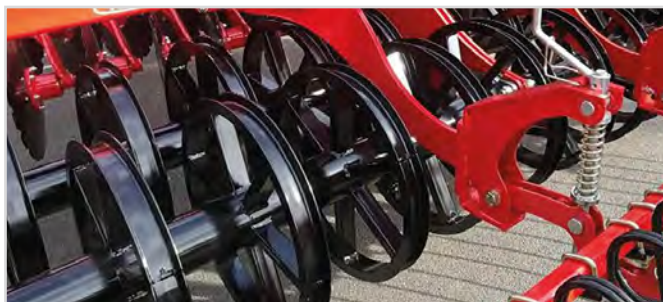
Ø600 mm U-Profilvals Twin

*Kräver 3 st. dubbelverkande oljeuttag och 1 st. enkelverkande oljeuttag.