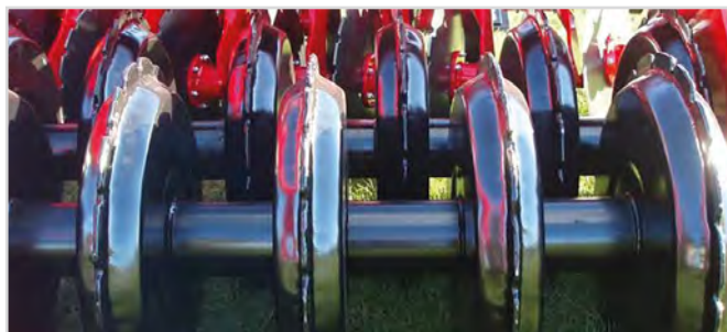
Ø600 mm V-Profilvals Twin