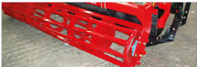
Ø550 mm Rörvals med fyrkantsrör

1* Kräver 2 st dubbelverkande oljeuttag och 1 st. enkelverkande oljeuttag.