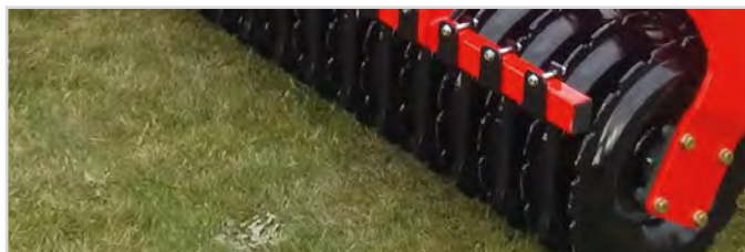
Ø600 mm V-Profilvals