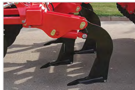
Conception de la dent sur Combi-Disc et Combi-Tiller MKII