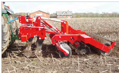
Combi-Disc avec dents relevées. Seule la fonction de déchaumage est employée.