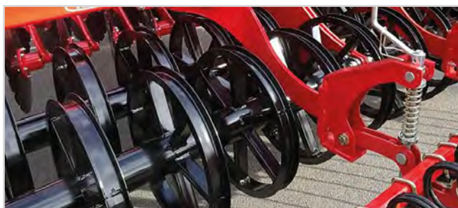
Rouleau double Twin U-profil Ø600 mm

*Requiert 3 prises double effet + 1 prise simple effet.