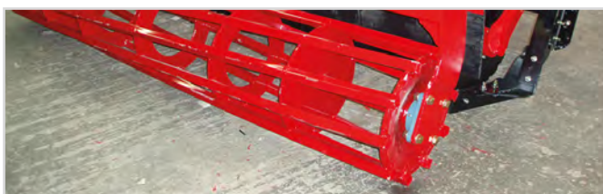
Rouleau tubes carrés Ø550 mm

*Requiert 2 prises double effet + 1 prise simple effet.