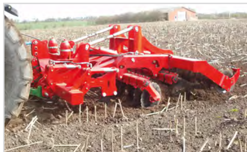
Combi-Disc avec dents à profondeur maximum. Décompactage, déchaumage et retassement combinés.