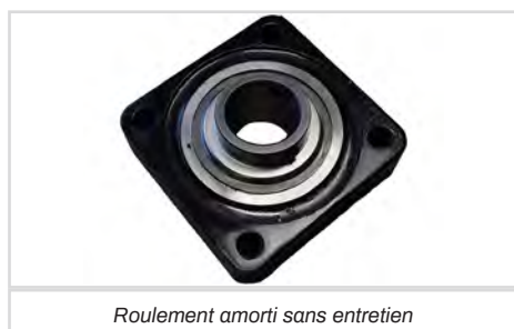
Roulement amorti sans entretien