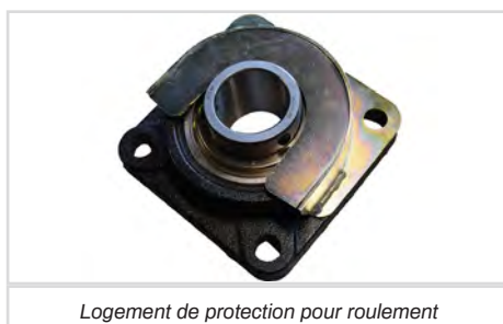
Logement de protection pour roulement