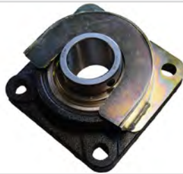
Lagerschutz für Packwalze