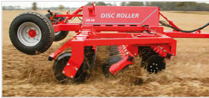
5,00 m mit V-Profilringen und Spritztuch für das Material