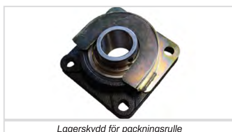
Lagerskydd för packningsrulle