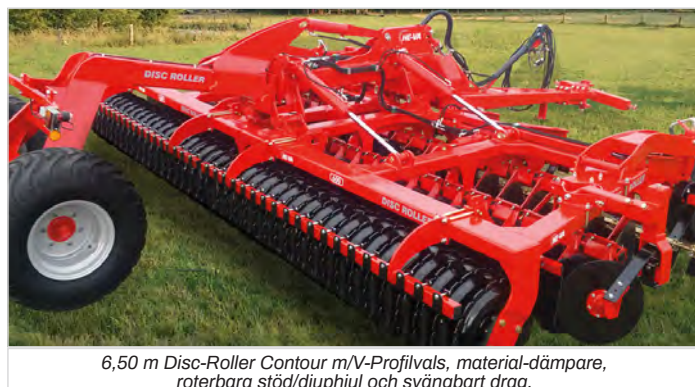
6,50 m Disc-Roller Contour m/V-Profilvals, material-dämpare, roterbara stöd/djuphjul och svängbart drag.