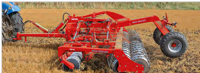
5,50 m Disc-Roller Contour med Twin V-Profilvals och material-dämpare.