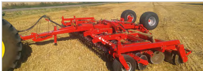
8,00 m Disc-Roller Contour med V-Profilvals och roterbara stödhjul.