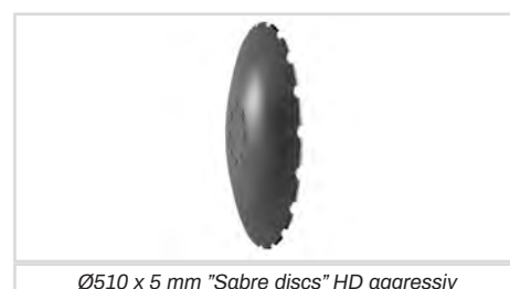
Ø510 x 5 mm "Sabre discs" HD aggressiv