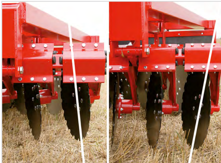
Standardutrustning på alla modeller: "DSD": Dybde Synkron Disc-aggressivitet.