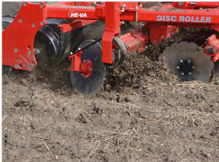
Standardutrustning på alla modeller: Justerbar kantallrik för jämn övergång mellan dragen, höger sida.