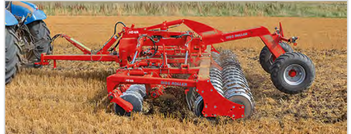
5,50 m Disc-Roller Contour avec rouleau double Twin V-Profil et tablier caoutchouc.