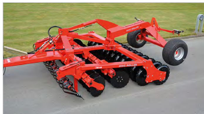
Disc-Roller Contour 3,5 m avec rouleau Twin V-Profil et Spring-Board