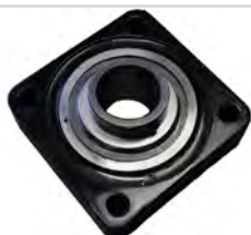
Roulement amorti sans entretien