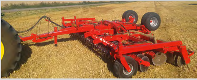
8,00 m Disc-Roller Contour avec rouleau V-Profil et roues support tournantes.