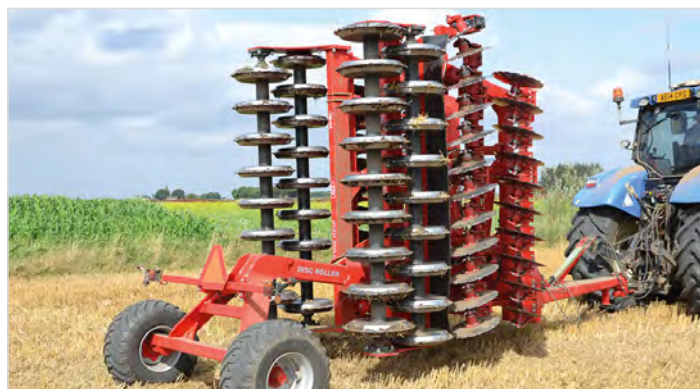
Disc-Roller Contour 5,5 m avec rouleau Twin V-Profil et tablier caoutchouc