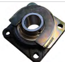
Logement de protection pour roulement