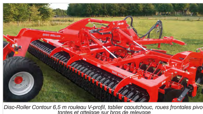
Disc-Roller Contour 6,5 m rouleau V-profil, tablier caoutchouc, roues frontales pivotantes et attelage sur bras de relevage