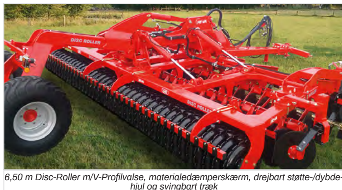
6,50 m Disc-Roller m/V-Profilvalse, materialedæmperskærm, drejbart støtte-/dybdehjul og svingbart træk