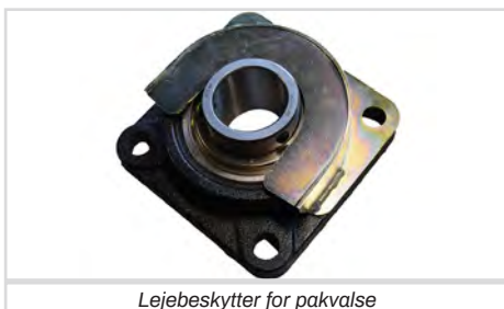
Lejebeskytter for pakvalse