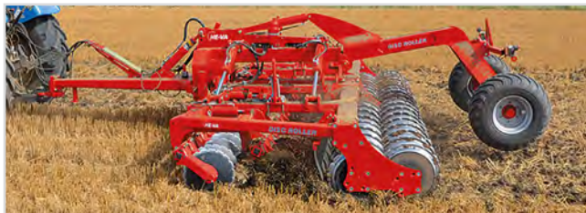
5,50 m Disc-Roller Contour med Twin V-Profilvalse og materialedæmperskærm.