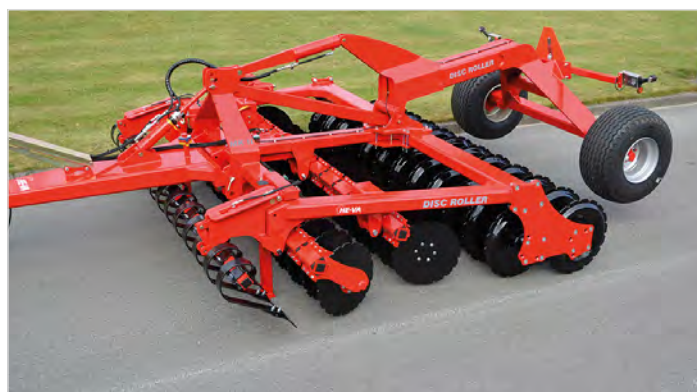
3,50 m Disc-Roller Contour bugseret m/Twin V-Profilvalse og Spring-Board.