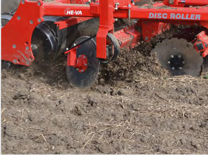
Standardudstyr på alle modeller: Justerbar kanttallerken for jævn overgang mellem hvert træk, højre side.