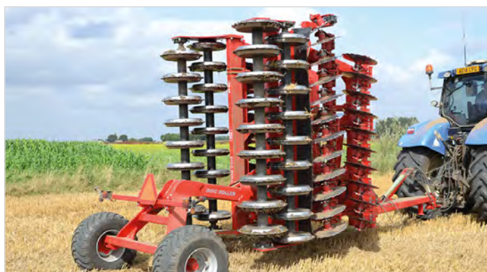
5,50 m Disc-Roller Contour m/Twin V-Profilvalse og materialedæmperskærm.