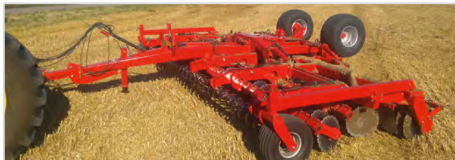
8,00 m Disc-Roller Contour med V-Profilvalse, drejbare støtte/dybdehjul.