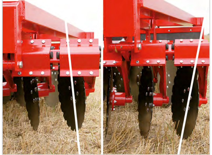
Standardudstyr på alle modeller: "DSD": Dybde Synkron Disc-aggressivitet.