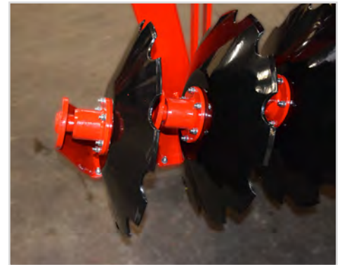
Ø610 mm tallrik med grov skärprofil