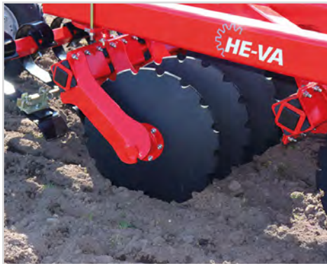
Standard tallrik, 610 mm - fin profil