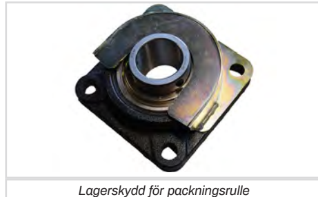
Lagerskydd för packningsrulle