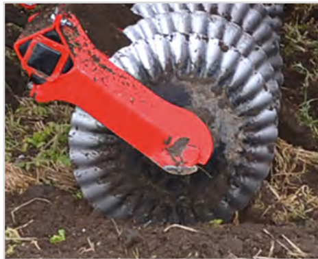
Ø570 x 5 mm tallrik