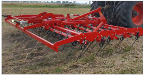
6,00 m Top-Strigle m/5 axlar och 16 mm pinnar