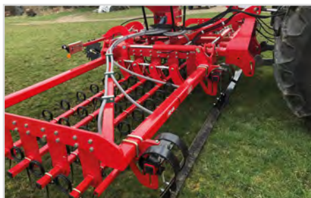
Utjämnarplanka med höjdstyring