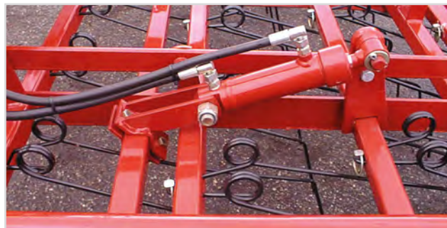
Hydr. inställning av pinnaggressivitet