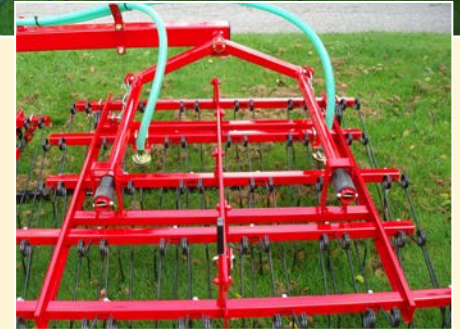
Doppelte Verteilerteller gewährleisten präzises / gleichartiges Aussäen.