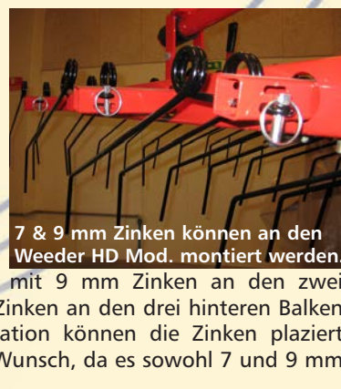
7 & 9 mm Zinken können an den Weeder HD Mod. montiert werden.

Weeder HD Modelle sind mit 7 oder 9 mm Zinken an allen 5 Balken lieferbar. Außerdem sind sie mit 9 mm Zinken an den zwei vorderen Balken und mit 7 mm Zinken an den drei hinteren Balken lieferbar. Als die letzte Kombination können die Zinken plaziert oder abmontiert werden - nach Wunsch, da es sowohl 7 und 9 mm Schlitze in allen 5 Balken gibt.