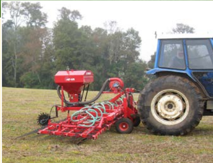
Multi-Seeder, Modell 410-16-HY.

Zusatzrüstung: Bei Montage vom HE-VA pneumatischen Multi-Seeder an HE-VA Weeders (Seed-Weeders) wird die Möglichkeit für genaues Aussäen von Grassamen gleichzeitig mit dem Eggen erreicht.