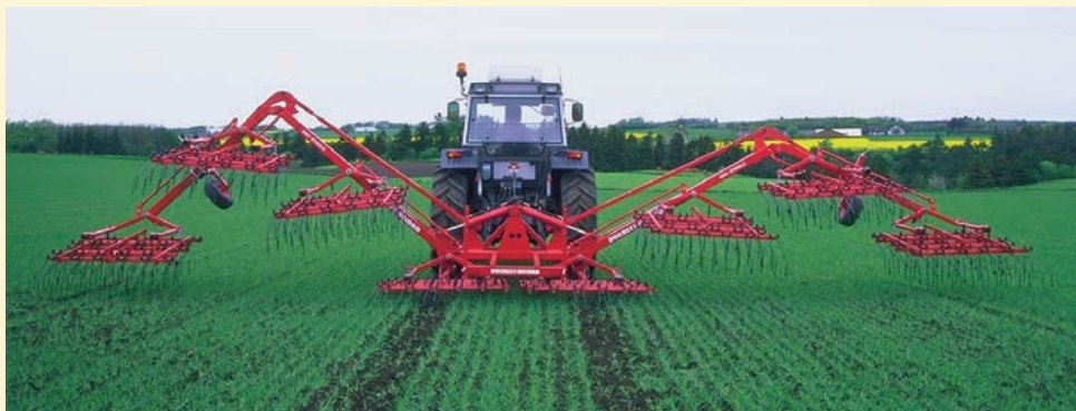
12 m Modell: das hydr. Klappsystem im Feld.

1,5 m pendeln aufgehängte Striegelsektionen im Feldeinsatz mit 2,5 cm Zinkenstrichabstand.