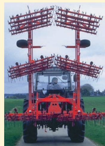
9 m Modell in Transportstellung.