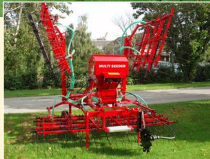
Multi-Seeder, Modell 200-8-EL.