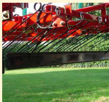
Zusatzrüstung: Einebnungsblech für alle Modelle.