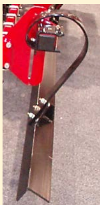
Zusatzrüstung: Planierschiene, gefedert, schwer. Nur für 6,00, 7,50 und 9,00 m.

Unkrauteggen wird von 8-10 Tage max. 14 Tage nach dem Auflaufen des Getreides durchgeführt, wenn das Getreide typisch 2-4 Blätter hat. Die Zinkenstellung ist am besten bei einer Mittelstellung und wird mit einer Arbeitstiefe von 1-2 cm durchgeführt & einer Fahrtgeschwindigkeit von 5 km/st.