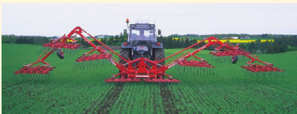
12 m mallin lohkojen avaus.

1,5 m äeslohko ohrakasvustossa, 2,5 cm piikkiväli.