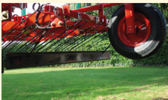
Lisävaruste: Tasauslata, tehokas esim. myyrän kekojen tasaamiseen.

Rikkaaestys tehdään 8-10 päivää, enintään 14 päivää, viljan orastumisen jälkeen, jolloin se on 2-4 lehtivaiheessa. Piikit toimivat parhaiten säädön puolesta välissä ja muokkaus tehdään 1-2 cm syvyyteen. Ajonopeuden tulee olla noin 5 km/h.