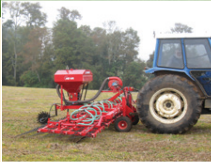
Multi-Seeder, malli 410-16-HY.

Lisävaruste: Kun pneumaattinen HE-VA Multi-Seeder asennetaan HE-VA Weederiin (Seed-Weeder), voidaan piensien kylvää samanaikaisesti pellon äestyksen yhteydessä.