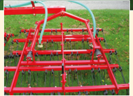
Kaksoislevityslevyt varmistavat hyvän kylvötuloksen.

Lisätietoja saat tilaamalla HE-VA Multi-Seeder -esitteen.