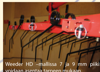
Weeder HD -mallissa 7 ja 9 mm piikit voidaan asentaa tarpeen mukaan.

Weeder HD voidaan toimittaa 7 tai 9 mm piikeillä kaikissa 5 akselissa. Lisäksi se voidaan toimittaa 9 mm piikeillä kahdessa ensimmäisessä akselissa ja 7 mm piikeillä kolmessa viimeisessä akselissa. Viimeisenä vaihtoehtona on piikkien asennus tai irrottaminen tarpeen mukaan, sillä kaikissa viidessä piikkiakselissa on sekä 7 että 9 mm kiinnikkeet.