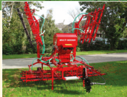
Multi-Seeder, malli 200-8-EL.