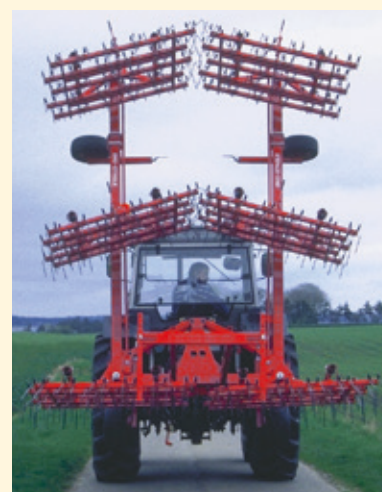
9 m mallin kuljetusasento.