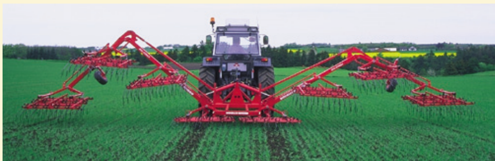
Model od 12m – prikaz sklapanja mašine u transportni položaj.

Eko drljača sa sekcijom od 1,5m, koja slobodno prati teren sa rastojanjem između radnih tela od 2,5cm.