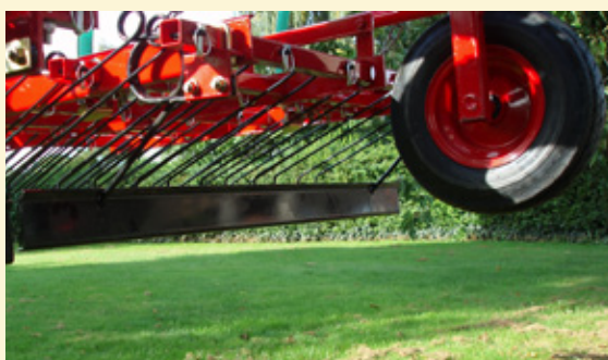
Ekstra oprema: Daska za nivelaciju. Veoma efektna: na primer za ravnanje krličnjaka.

Normalno čupanje korova se sprovodi 8-10 dana nakon klijanja kada usevi obično imaju 2-4 lista, a 14 dana je maksimalno odlaganje. Najbolji rezultati se dobijaju sa centralnom pozicijom ugla opruga, dubina od 1-2cm i brzina 5km/h.