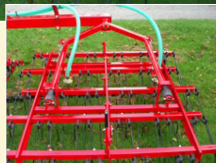
Dupli razbacivači semena obezbeđuju preciznu/ujednačenu setvu semena.

Za više informacije o Multi-Seeder uređaju za setvu, potražite prospektat.