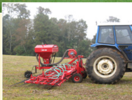
Multi-Seeder, model 410-16-HY.

Dodatna oprema: Kada montirate HE-VA pneumatski Multi-Seeder uređaj za setvu na HE-VA Eko drljaču & HE-VA Eko drljaču HD, garantovano dobijate preciznu setvu semena zajedno sa čupanjem korova.