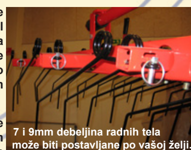
7 i 9mm debljina radnih tela može biti postavljane po vašoj želji.

HE-VA Eko drljača HD je dostupna sa 7 i 9mm debljinom radnih organa na svim redovima u sekcijama. Eko Drljača HD može da ima na prva dva reda radnih organa tela debljine 7mm, a ostali redovi 9mm. Kao krajnja opcija moguće je i postavljanje radnih tela po vašoj želji.