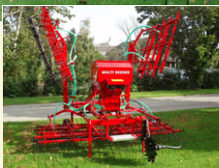
Multi-Seeder, model 200-8-EL.