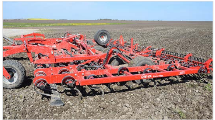
9,00 m Euro-Tiller m/65x12 mm tænder m/Spring-Board, ekstra række 65x12 mm tænder, Spring-Board-efterharve, langfinger-efterharve, og frontstøtkehjul.