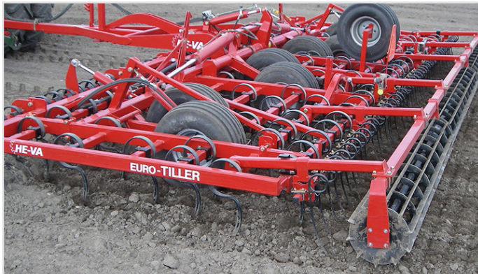
8,00 m Euro-Tiller m/ Spring-Board plankor, vals inkl. långfinger-efterharv och reservhjul.