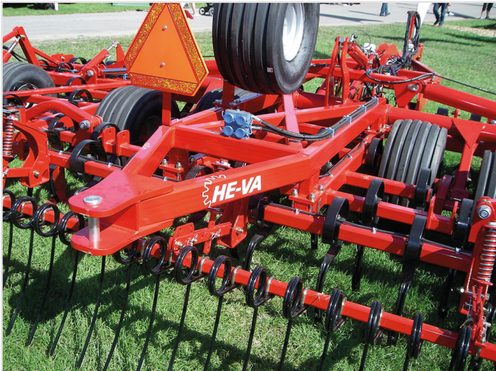
Euro-Tiller med drag för t.ex ringvält.