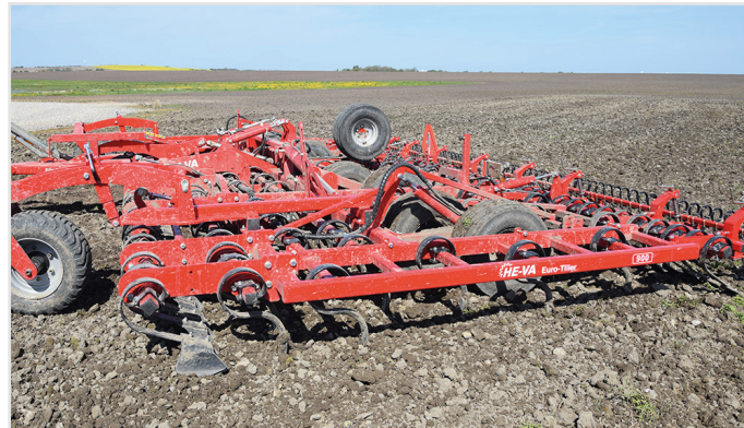
9,00 m Euro-Tiller m/65x12 mm pinnor m/Spring-Board, extra rad 65x12 mm pinnor, Spring-Board bak, långfinger-efterharv, och stödhjul fram.