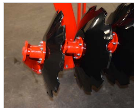
Ø610x6 mm disc med grov skæreprøfil