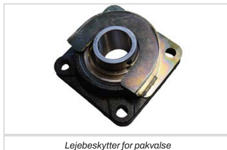
Lejebeskytter for pakvalse