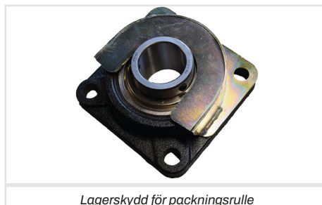
Lagerskydd för packningsrulle