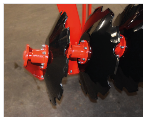
Ø610x6 mm tallrik med grov skärprofil