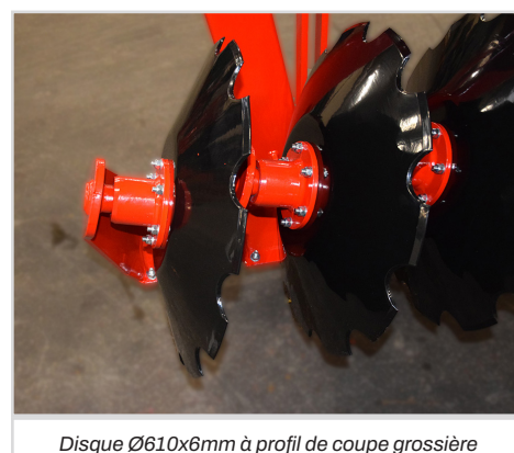
Disque Ø610x6mm à profil de coupe grossière