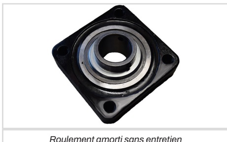
Roulement amorti sans entretien