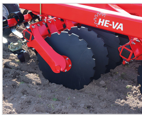
Disque standard Ø610x6mm - à profil de coupe fine