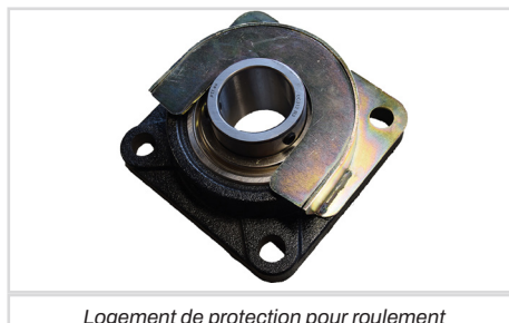
Logement de protection pour roulement