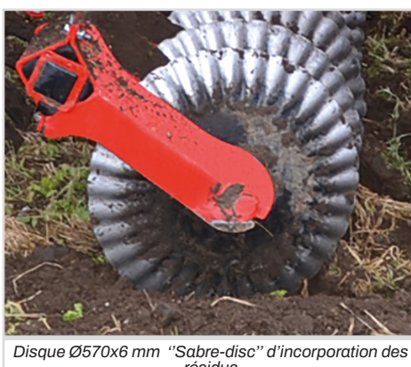
Disque Ø570x6 mm "Sabre-disc" d'incorporation des résidus